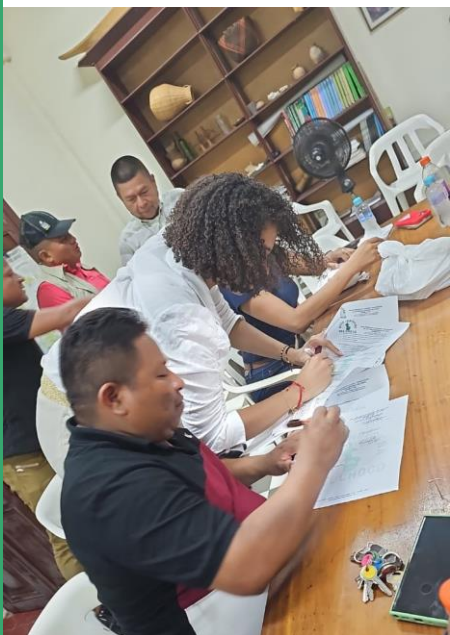
LA FOTO: La gobernadora Nubia Carolina Córdoba Curi y el líder indígena Mario Isaramá, en la firma del acuerdo, que dio fin a la minga, indígena en su segundo día de protesta

Luego de dos días la minga indígena, que reclamaba el pago de un faltante de 30 mil millones de pesos del servicio educativo indígena de la vigencia 2023, el día cuatro de abril, se logró un acuerdo con los gobiernos nacional y departamental para el cumplimiento de ese compromiso con las organizaciones indígenas del departamento del Chocó que como operadores prestan el servicio educativo a unos 35 mil estudiantes indígenas.