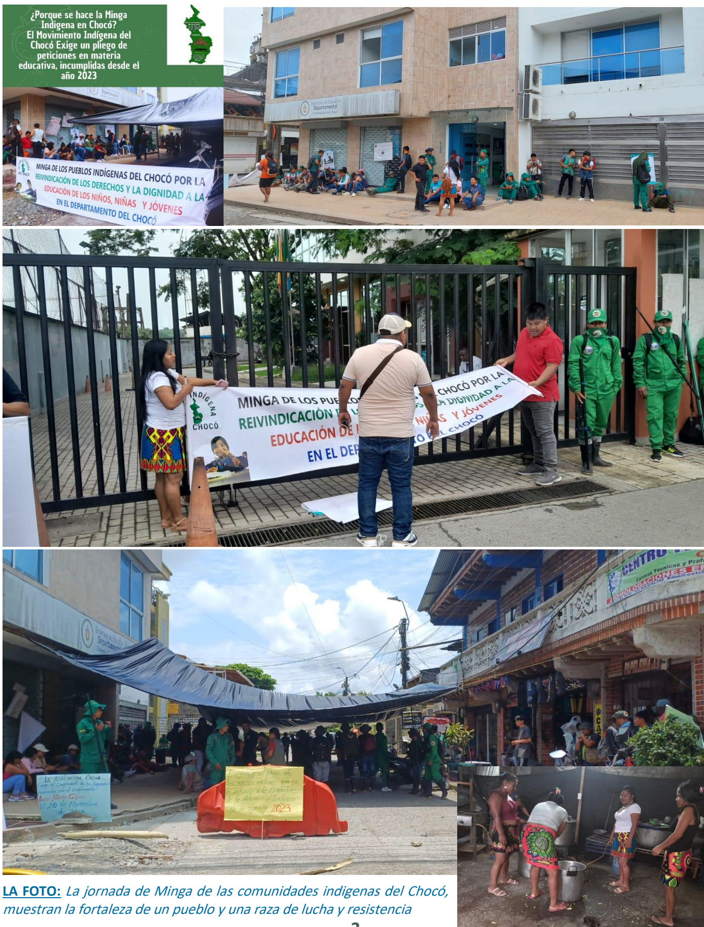
LA FOTO: La jornada de Minga de las comunidades indígenas del Chocó, muestran la fortaleza de un pueblo y una raza de lucha y resistencia