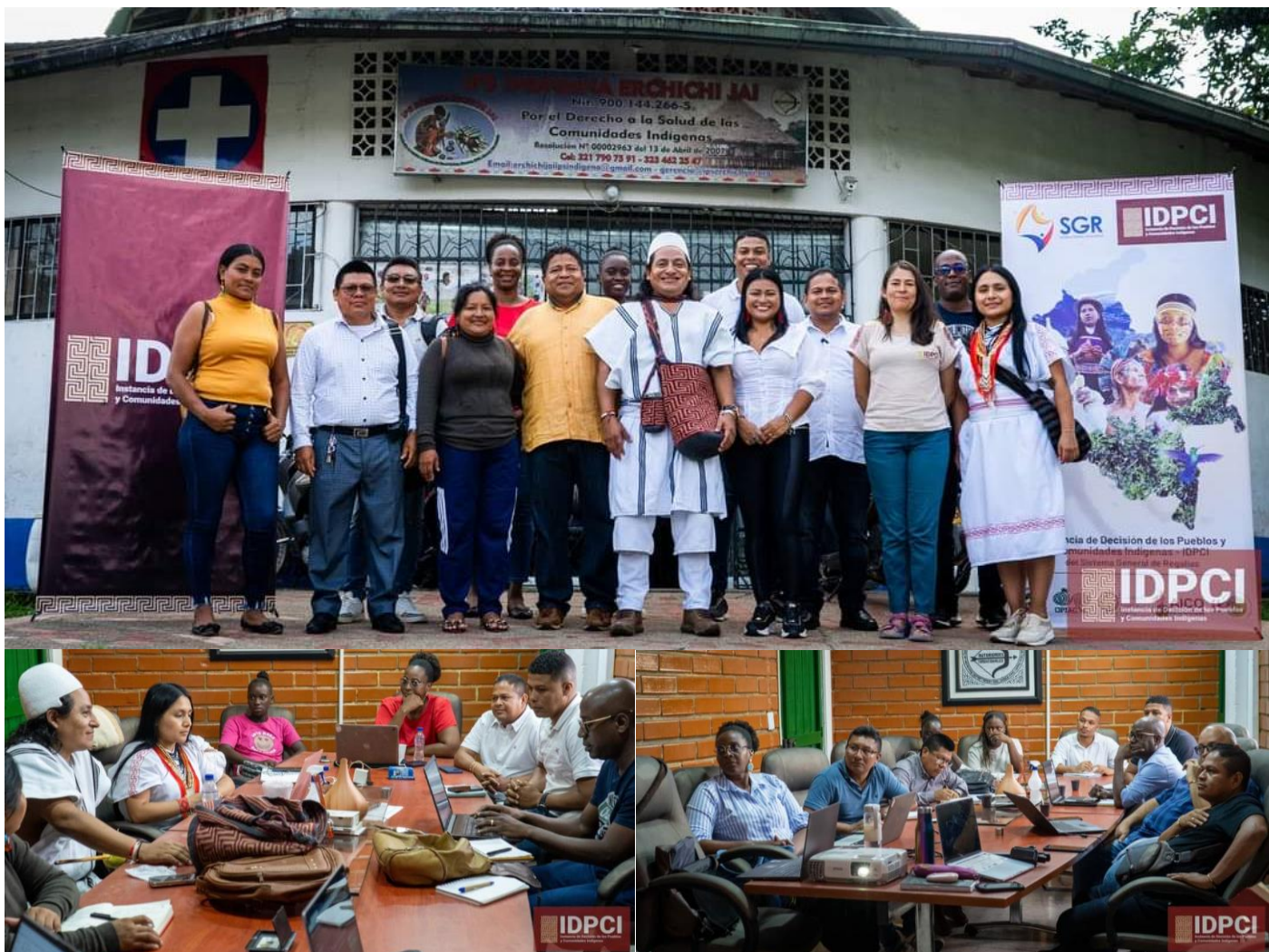
Secretaria Técnica de la Instancia de Decisión de los Pueblos y Comunidades indígenas – DPCI del Sistema General de Regalías. Ley 2056 de 2020, art, 74,75 y 76.

🌿 #IDPCIInforma | Por invitación de la Asociación Orewa Chocó la Secretaria Técnica de la Instancia de Decisión de los Pueblos y Comunidades Indígena hizo presencia en Quibdó para dialogar sobre regalías para Pueblos Indígenas. Gracias a las autoridades del Pueblo Embera Dobida, Katío, Chamí y Tule por la invitación y continuamos #IDPCIporLosTerritoriosIndigenas.